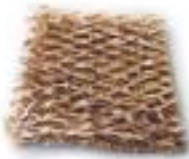
Teilstück einer Matte Gewicht: 10 g