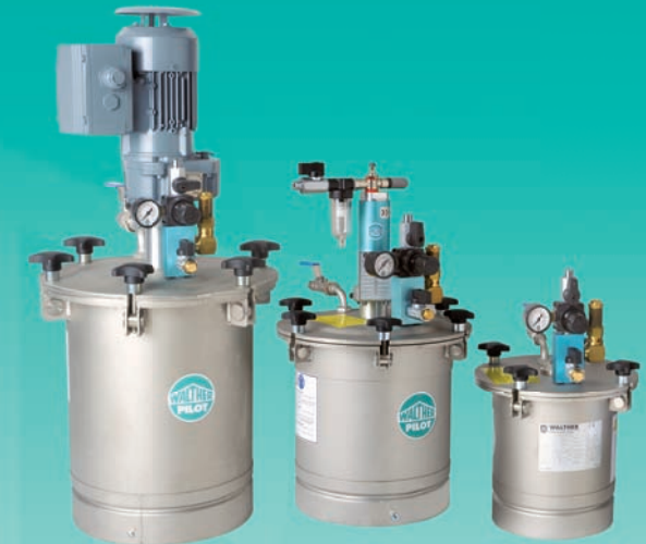
LDG 20: Keine Bestückung mit Inlinern möglich.

Die dünnwandigen und leichtgewichtigen Druckbehälter LDG 5, 10 und 20 sind komplett aus Edelstahl gefertigt. Sie können auf Wunsch mit Rührwerken bestückt werden.